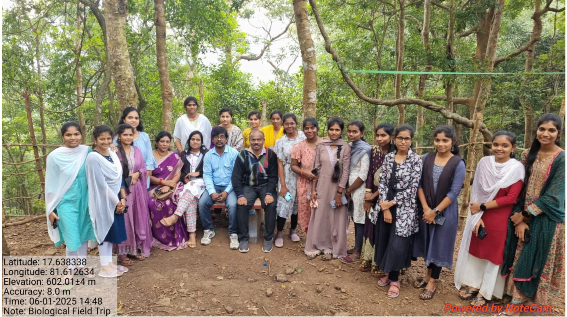
Latitude: 17.638338 Longitude: 81.612634 Elevation: 602.01±4 m Accuracy: 8.0 m Time: 06-01-2025 14:48 Note: Biological Field Trip