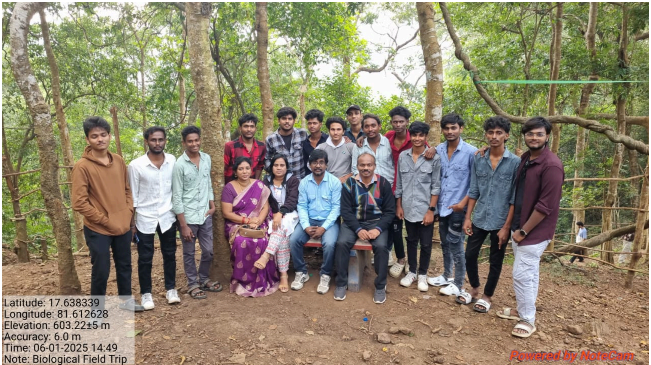
Latitude: 17.638339 Longitude: 81.612628 Elevation: 603.22±5 m Accuracy: 6.0 m Time: 06-01-2025 14:49 Note: Biological Field Trip